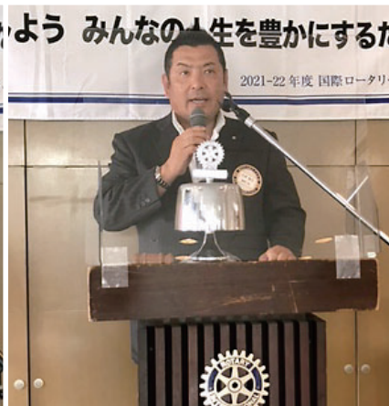
三つのお祝い卓話 大原会員